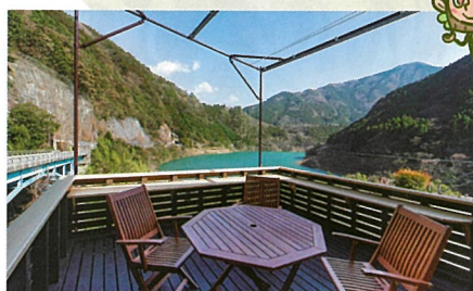
争奪戦になるほど大人気だというテラス席。四季折々、美しい風景を楽しめる。