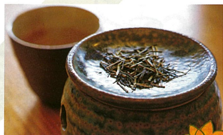
香炉の下から火を当てると燻され、茶葉のいい香りが立ちのぼる。