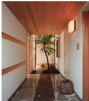
玄関から光庭が見えます