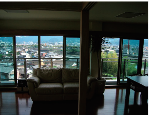
リフォームで新しい景色が広がりました。