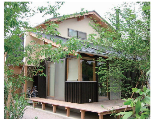
広いデッキで犬と遊びます

住まう人の物語を共有してきた私たちが、 これまで重ねた年月の中で 手がけた建物や家には ひとつとして同じものはありません。 まずは、あなたの想いを私たちに 聞かせてください。 世界にただひとつ、あなただけの 「住まいの物語」を 私たちと一緒に紡いでいきませんか？