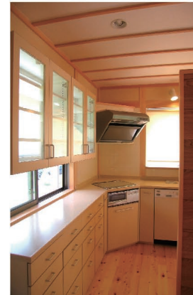
収納たっぷり、私だけの オーダーキッチン

高知に生まれ育った私たち夫婦が 家づくりの仕事をスタートして 25年が経ちました。