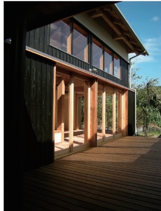
高知の木をたっぷり使って増築しました。