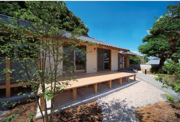
第二の人生は平屋でゆっくり暮らしたい

「どうしたいー」という強い想いには、 さらなる輝きを。 「どうしたらいいか…」という迷いには じっくり対話を。 そうして出来上がった建物や家には、 住まう人の暮らしに添った希望や 憧れという名の「物語」が色濃く、 しっかりと刻まれていきます。